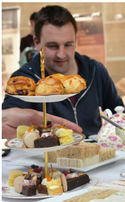
Afternoon Tea / Cutty Sark