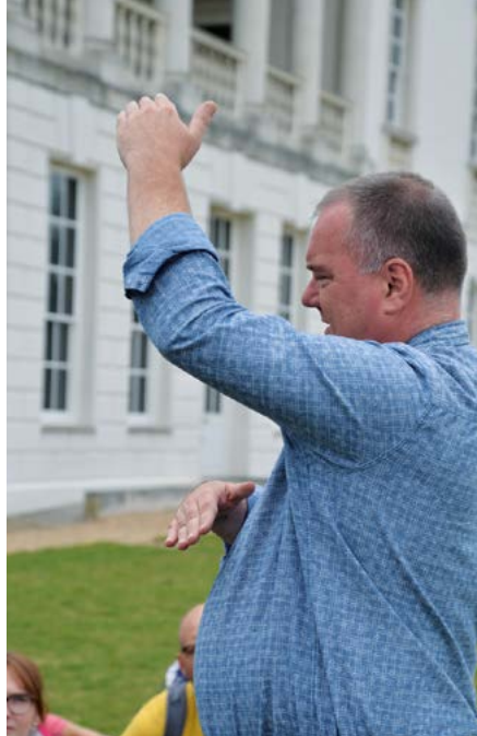
Guided Walk / Greenwich

Der Rundgang führt durch die Sitzungssäle des House of Commons und des House of Lords und erklärt anschaulich das politische System. Besichtigt werden neben den ältesten Teilen, deren Bau schon 1097 unter dem Sohn von William the Conqueror begonnen wurden, u. a. auch der „Robing Room“ der Queen und die Royal Gallery.