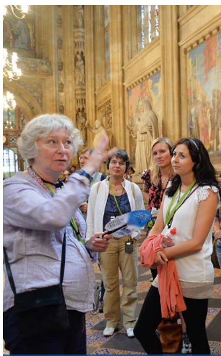
Guided Tour / Houses of Parliament